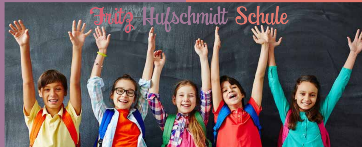
Flyerdesign: Design im SINN | Nadine Müller